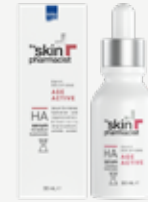
SKIN PHARMACIST HA SERUM Ορός προσώπου με 4 μορφές υαλουρονικού. 30 ml