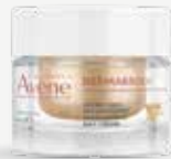
AVÈNE DERMABSOLU Βασική κρέμα ημέρας προσώπου, επαναπυκνώνει το δέρμα και προσδίδει τόνωση. 50 ml