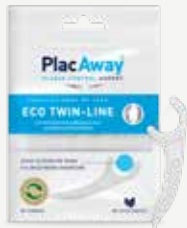
Eco Twin-Line Flossers Διπλό Λευκαντικό Οδοντικό Νήμα με Λαβή. 30 τμχ.