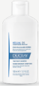
DUCRAY KELUAL DS SHAMPOO NC Σαμπουάν κατά της πιτυρίδας και της Σμηγματορροϊκής Δερματίτιδας για Όλους τους Τύπους Μαλλιών. 100 ml