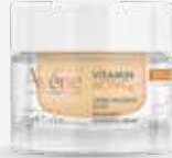
VITAMIN ACTIV Cg GEL CREAM Αντιρυτιδική gel κρέμα για εντατική λάμψη & μείωση της εμφάνισης καφέ κηλίδων χάρη στη δερματολογική βιταμίνη C. 50 ml