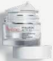
AVÈNE HYALURON ACTIV B3 Κρέμα προσώπου κυτταρικής ανανέωσης με νιασιναμίδη και υαλουρονικό οξύ. 50 ml