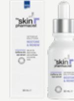
SKIN PHARMACIST CAFFEINE EYE SERUM Ορός για την περιοχή των ματιών. 30 ml