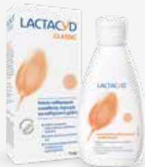
Καθαριστικό Ευαίσθητης Περιοχής 300 ml