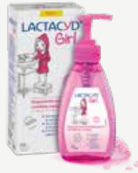
Girl 200 ml