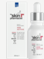
SKIN PHARMACIST VITAMIN C SERUM Ορός προσώπου με 10% βιταμίνη C. 30 ml